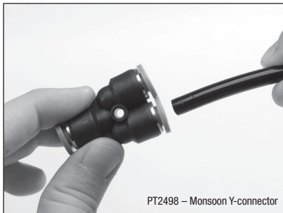
PT2498 – Monsoon Y-connector

ADDITIONAL ACCESSORIES AVAILABLE ACCESSOIRES SUPPLÉMENTAIRES DISPONIBLES ZUSÄTZLICHES ZUBEHÖR ERHÄLTLICH ACCESORIOS ADICIONALES DISPONIBLES ACCESSORI AGGIUNTIVI DISPONIBILI EXTRA ACCESSOIRES VERKRIJGBAAR