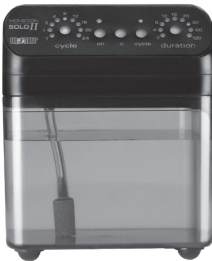
MONSOON SOLO II Programmable Misting System