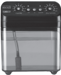
MONSOON SOLO II Programmable Misting System