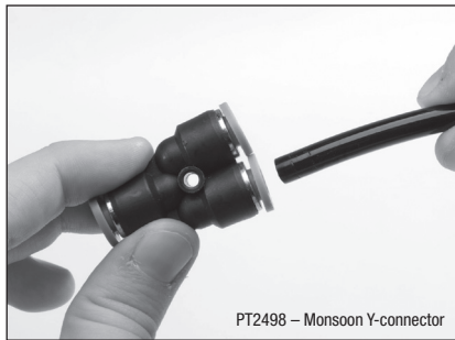
PT2498 – Monsoon Y-connector

ADDITIONAL ACCESSORIES AVAILABLE ACCESSOIRES SUPPLÉMENTAIRES DISPONIBLES ACCESORIOS ADICIONALES DISPONIBLES