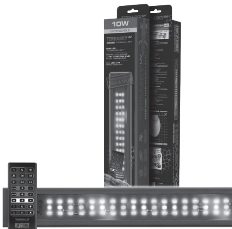
TERRASKY UV UVB LED Terrarium Light PT2414